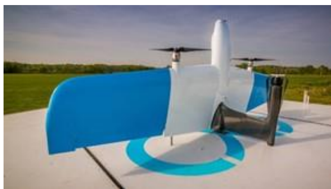
Rysunek 2. SkyX; www.skyx.com

Drugim z rozpatrywanych przypadków BSP jest VTOL. W oparciu o istniejące rozwiązania i produkty opracowano model koncepcyjny VTOL-a tail-sittera. Koncepcyjny BSP oparty na istniejącej konstrukcji posłużył do zbadania możliwości wydłużenia czasu lotu poprzez zainstalowanie na jego konstrukcji paneli PV. Konstrukcja bazuje na komercyjnym VTOL-u firmy SkyX (Rysunek 2). Różnica polega jednak na zastosowaniu dwóch a nie jak w przypadku SkyX czterech silników elektrycznych. Takie zestawienie zostało skonfigurowane poprzez połączenie dwóch VTOL-i: SkyX oraz WingtraOne. Tail-sitter jest zbliżony wymiarowo do TS17. Rozpiętość skrzydeł wynosi 2.5m, a cięciwa nieco ponad 0.5m.