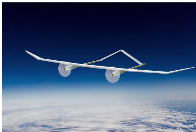
Rysunek 1. Twin Stratos

W rozprawie do obliczeń posłużono się dwoma modelami Twin Staratosa: TS17 oraz TS12. Celem było poznanie jak różnica skali wpłynie na zużycie oraz pobieranie energii. Jaki stosunek wyprodukowanej energii oraz zapotrzebowania energetycznego zostanie zachowany przy uwzględnieniu różnicy maksymalnych pułapów z uwagi na inną klasę obiektu. TS17 można zaliczyć do LALE UAV, z kolei TS12 do HALE UAV.